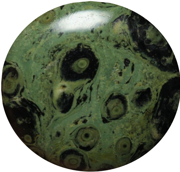
Kabamba aus Madagaskar